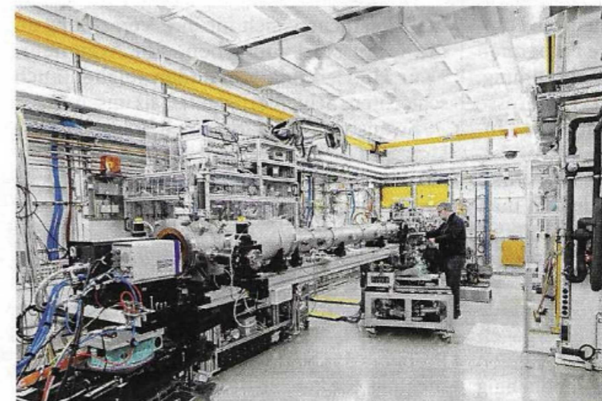
Röntgenquelle Petra III: Tief in das Innere der Dinge blicken